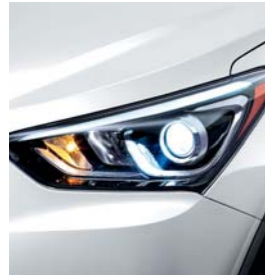
(SWP) Blanco Aperlado