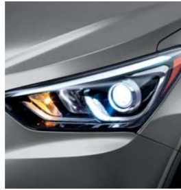
(IM) Gris Mineral