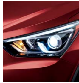
(TR3) Rojo Serrano