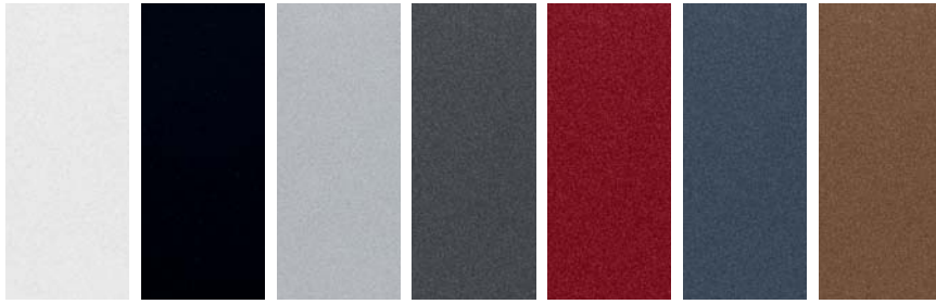
(PSW) Blanco (X5B) Negro (RHM) Plata (V3G) Gris (X2R) Rojo (U7U) Azul (P4N) Tierra